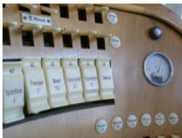
Detailaufnahme vom Spieltisch

... die Orgel einen klanglich eigenständigen Charakter hat, der sich grundlegend von den Neubauten der letzten Jahre unterscheidet und damit die Trierer Orgellandschaft bis heute ungemein bereichert.